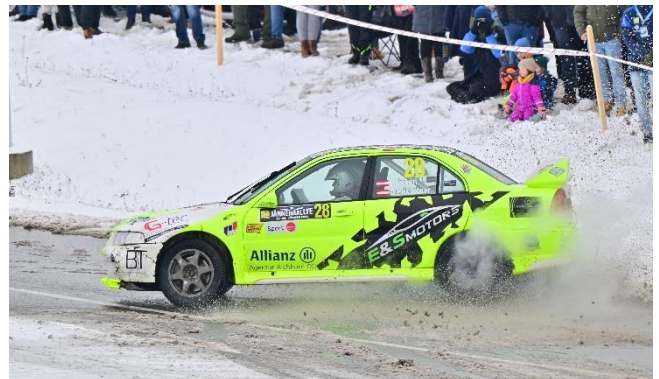
am Bild: Team J. Seiberl/D. Pirklbauer