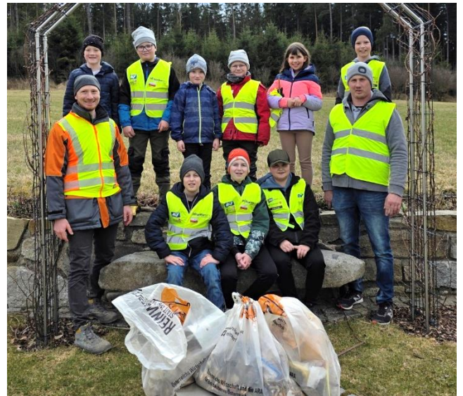
Jugendgruppe FF Prendt/Elmberg